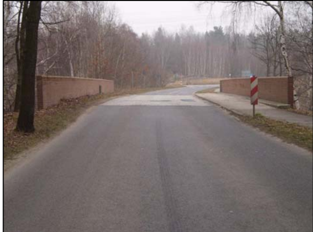
Brücke Kostebrauer Straße aus Richtung Lauchhammer-Ost

Wer zum Bau des Brückenbauwerkes, der zeitlichen Errichtung und dem damaligen Bauherren Aussagen machen kann, Unterlagen oder Bilder dazu hat, möchte sich bitte bei der Stadtverwaltung Lauchhammer, Fachbereich 1 – Frau Boog (Tel. 03574/488-403, Fax /488-650, E-Mail bauplanung@lauchhammer.de ) melden.